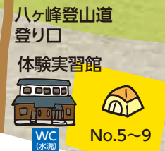
八ヶ峰登山道 入り口

八ヶ峰家族旅行村の周辺では福井県でも珍しい生き物たちが見られます。見つけても触ったり、持ち帰らないようにしましょう。皆さんで生態系を守りましょう。