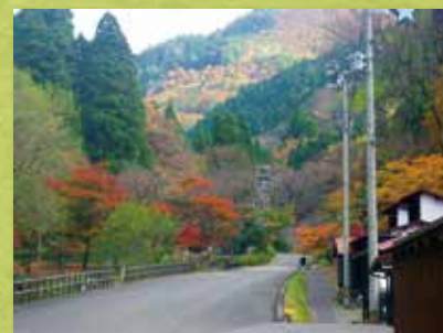
秋の紅葉はとて素晴らしいです

八ヶ峰家族旅行村の周辺では福井県でも珍しい生き物たちが見られます。見つけても触ったり、持ち帰らないようにしましょう。皆さんで生態系を守りましょう。