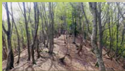
美しいブナの原生林