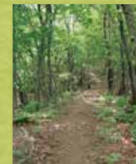
ブナ、ナラ林等登山道の景色